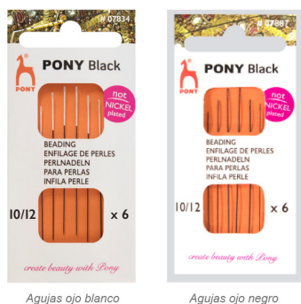
Agujas ojo blanco